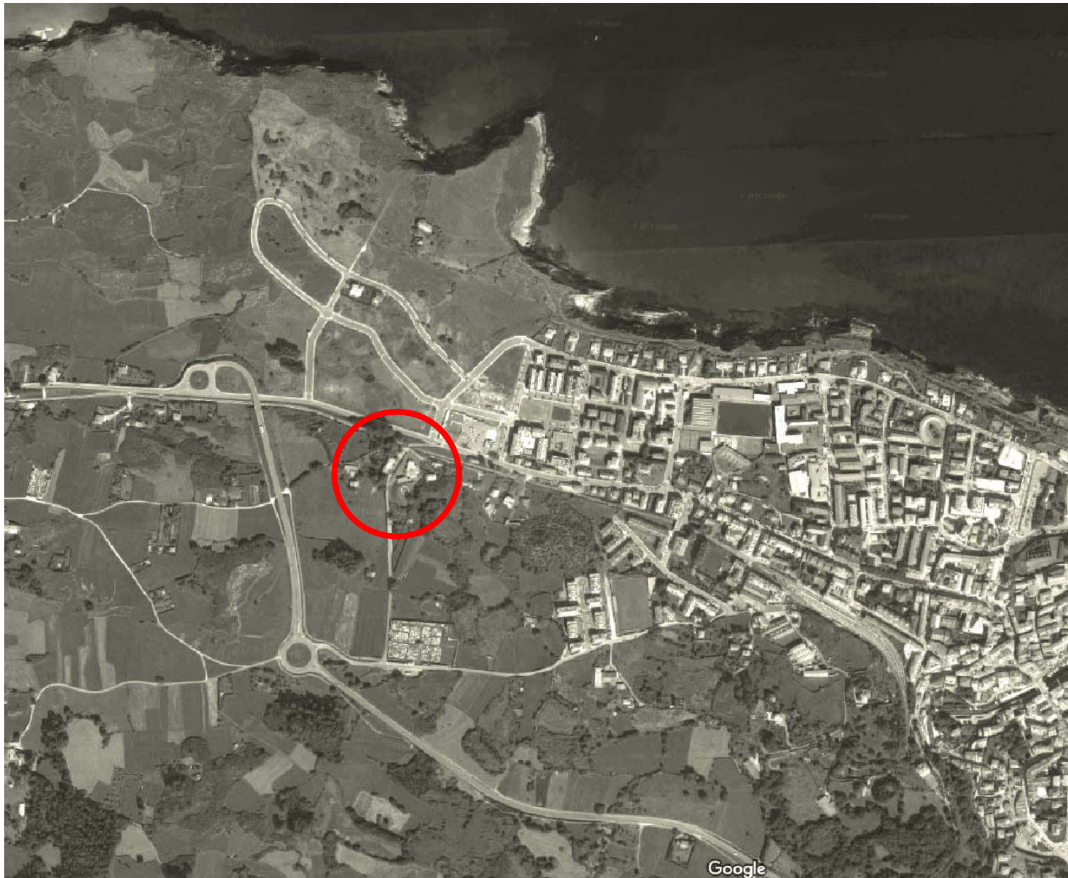
Situación E: 1/10.000