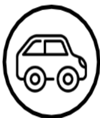
Unidad móvil (1)