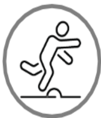
Detección de situaciones de riesgo