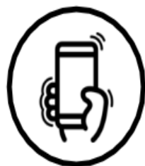
Aplicación móvil para familiares