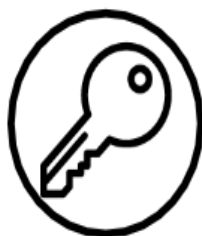
Custodia de llaves (1)

(1) Consultar disponibilidad en su población